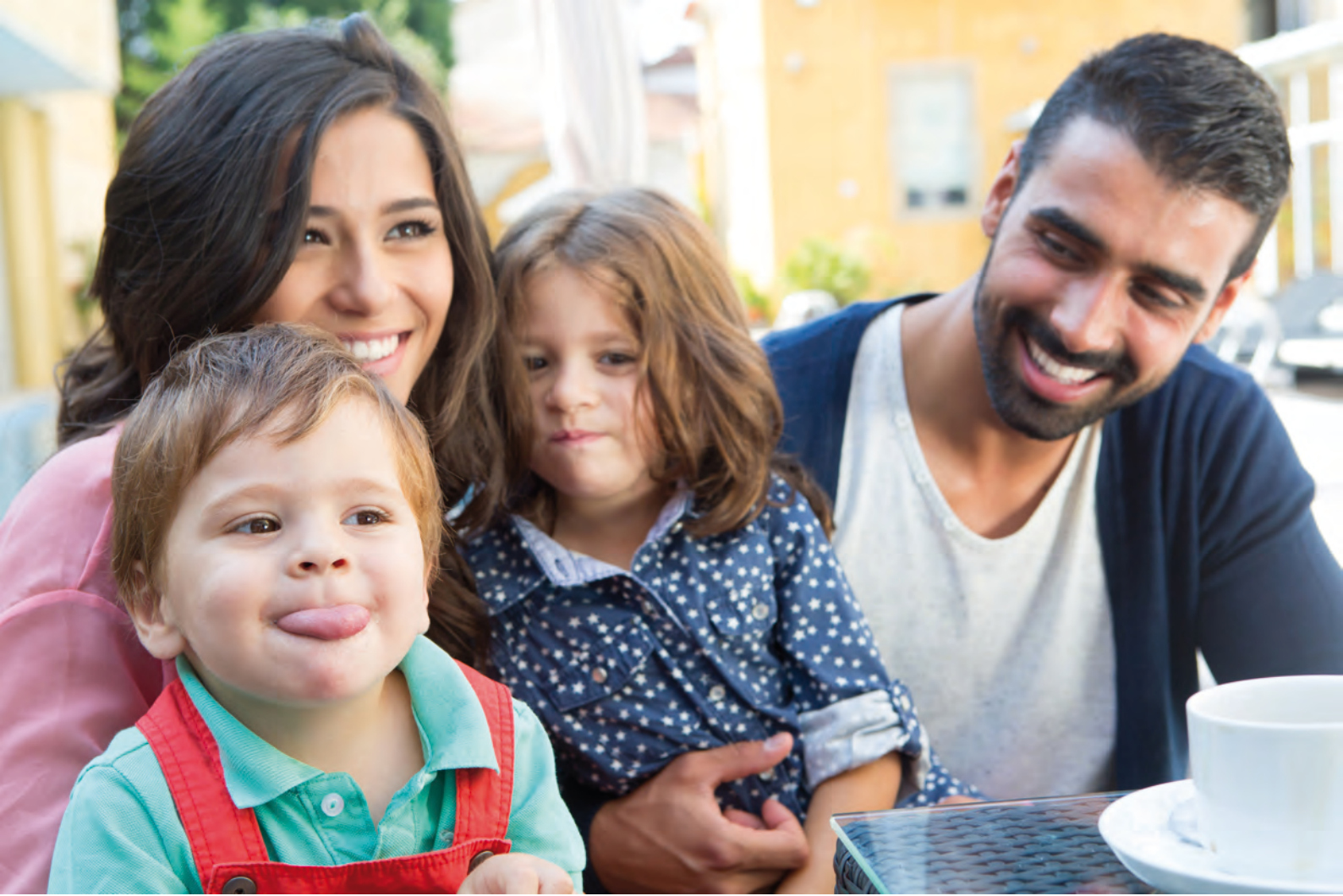
Schéma départemental des services aux familles Mai 2016