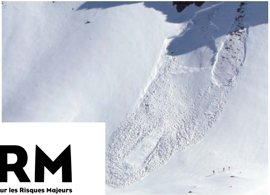
Avalanche de plaque au-dessus du lac du Crozet – La Combe de Lancey – Avril 2006