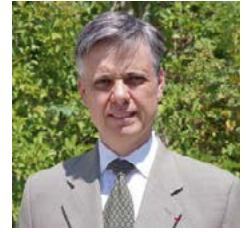
Lionel BEFFRE Préfet de l'Isère

La prévention des risques naturels et technologiques est l'affaire de tous : citoyens, acteurs privés et acteurs publics. La connaissance des risques nous permet de mieux réagir en cas de crise, en partageant les bons réflexes à adopter pour chacune des situations rencontrées.