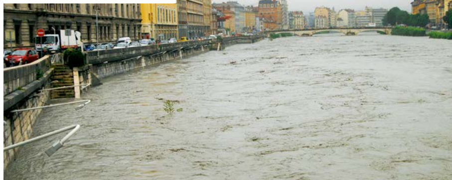
Grenoble - Crue de l'Isère - Mai 2008